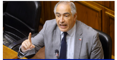
Senador Francisco Chahuán desmiente supuesto enroque electoral con Andrés Celis: "No he pensado en ser candidato a Diputado"