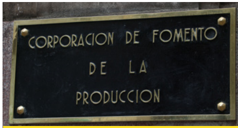
Corfo justifica millonarias transferencias al Ministerio de Hacienda y niega pérdidas