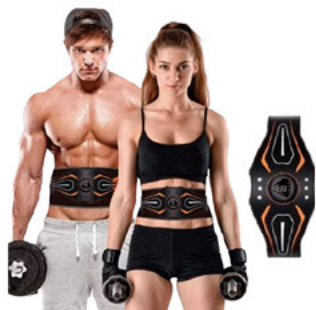
Estimulador Muscular Tonificador