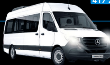
Nueva SPRINTER 417 28+1

Asistente de Cansancio (Attention Assist).