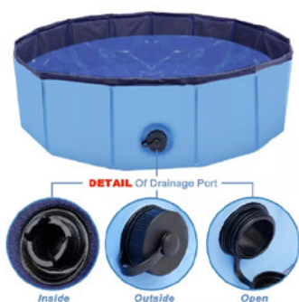
Piscina plegable para perros