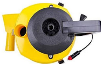
Aspiradora Turbo seco/húmedo para auto