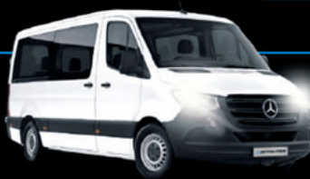
Nueva SPRINTER 417 24+1

Descansa y no pagues más enero y febrero.