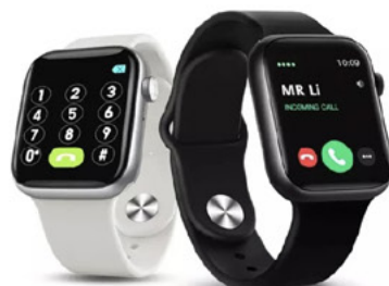
Reloj Smartwatch Series 9