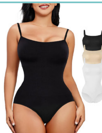
Body reductor con efecto push-up