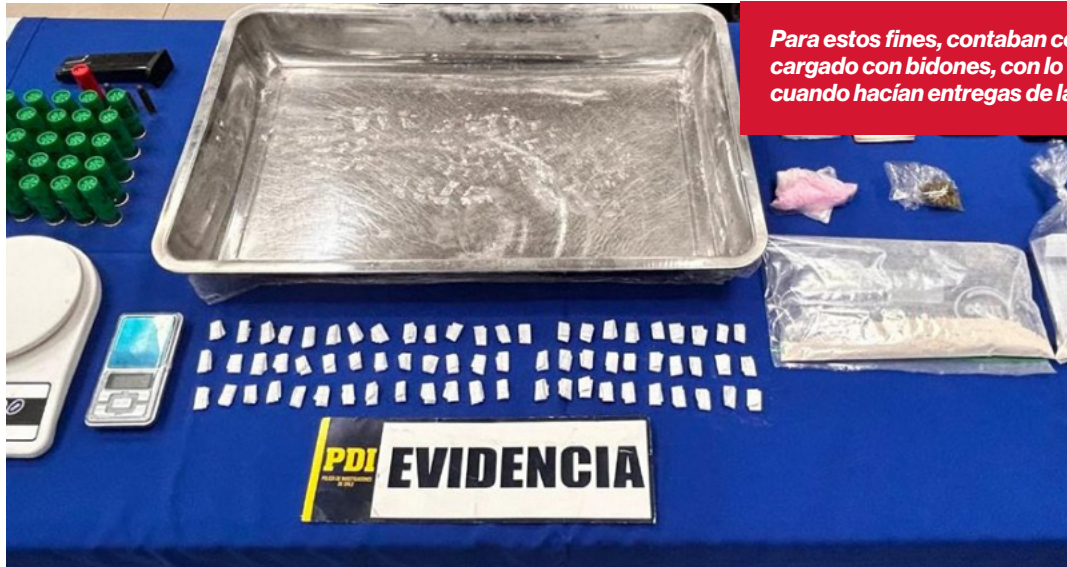
Para estos fines, contaban con un vehículo con el pick up cargado con bidones, con lo que solían pasar desapercibidos cuando hacían entregas de las sustancias ilícitas.

bidones, con lo que solían pasar desapercibidos cuando hacían entregas de droga. A través de distintas técnicas intrusivas, se logró recopilar una serie de antecedentes que permitieron conseguir órdenes emanadas por el Ministerio Público para hacer entrada y registro de tres inmuebles asociados a los aprehendidos. Desde dichos domicilios, fueron incautadas distintos tipos de drogas, tales como cocaína base, cannabis sativa y ketamina, además de un cargador de pistola y cartuchos de diferentes calibres. Como parte de las pesquisas, la PDI además decomisó elementos para la dosificación de sustancias ilícitas y 1 millón 400 mil pesos, ganancia producida por las transacciones al margen de la ley que realizaban.