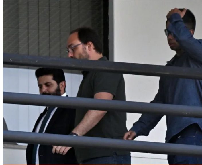
El hijo del expresidente Bolsonaro, Carlos, inició la semana declarando en la Procuraduría (Fiscalía).

el "núcleo político" obtuvo información confidencial a través de Ramagem, aunque se desconoce qué uso le dio a la misma.