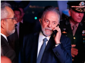
El presidente brasileño ha despedido al segundo de a bordo de los servicios secretos por sus nexos con Bolsonaro.

mando de la ABIN desde el mandato de Bolsonaro, no fue el único removido, pues otros cuatro directores también corrieron la misma suerte . Sin embargo, hasta el momento las autoridades no han informado las identidades de los otros despedidos.