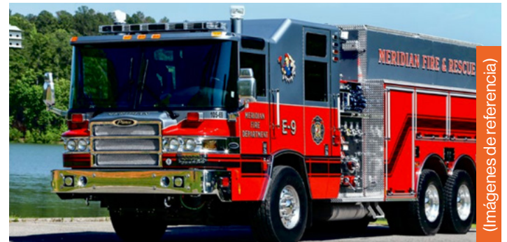
(Imágenes de referencia)

Finalmente, acerca de las críticas surgidas desde el Consejo Regional, la autoridad de Bomberos de Villa Alemana contó que "un Core me abordó y me dijo en tono de broma que "era caro el juguete". Para nosotros éste no es un juguete, porque este carro tiene un propósito". De igual forma, explicó que "como éste es un carro de especialidad, por eso tiene este valor. Un carro normal americano cuesta 1 millón de dólares, es decir $1.000 millones. Nosotros le agregamos $500 millones más por la dimensión del mismo, pero sobre todo por la bomba, por la capacidad de bomberos y también por los materiales que va a llevar. Un carro de especialidad es carísimo".