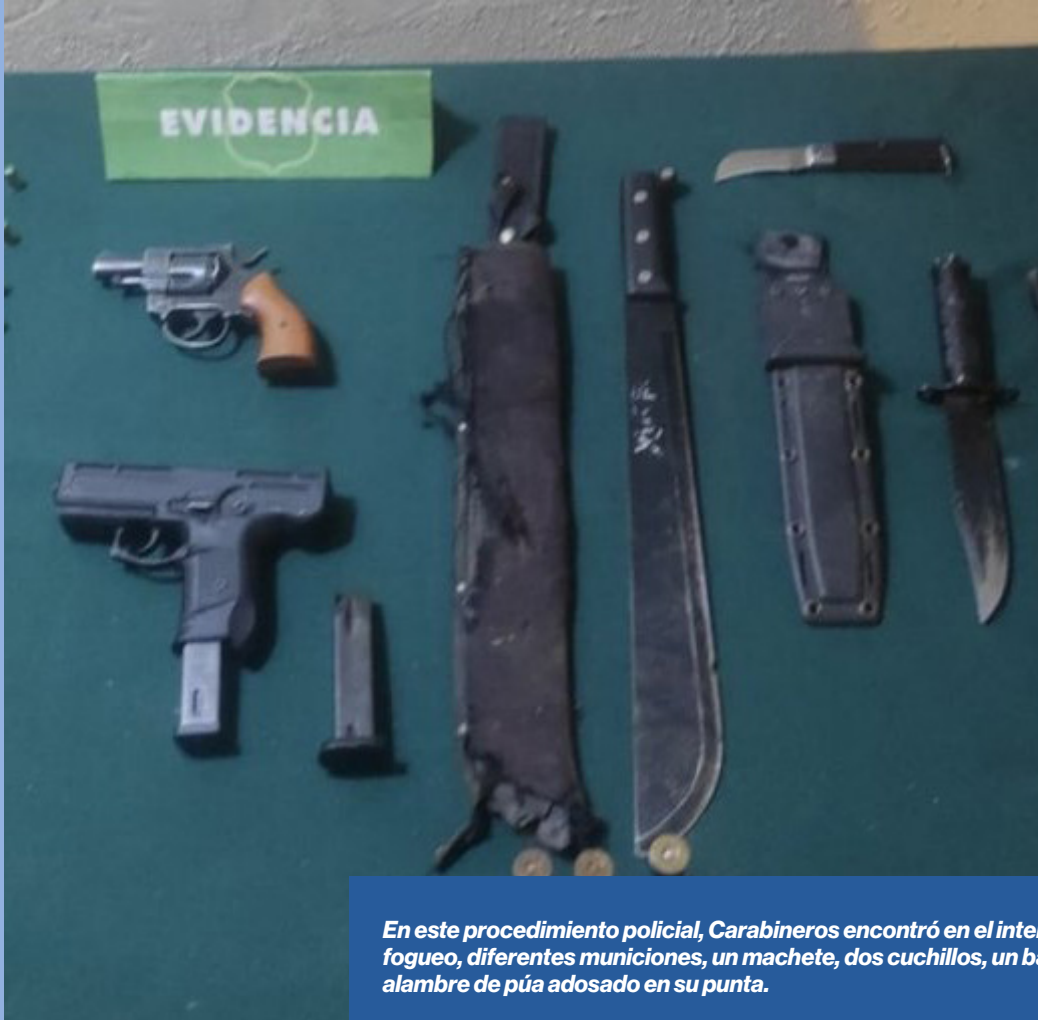
En este procedimiento policial, Carabineros encontró en el interior del móvil dos armas a fuego, diferentes municiones, un machete, dos cuchillos, un bastón retráctil y un bate con alambre de púa adosado en su punta.

A partir de denuncias de los vecinos, Carabineros de la Tenencia Nogales detuvo durante la tarde de este lunes a un sujeto quien portaba diferentes elementos utilizados habitualmente para la comisión de delitos.