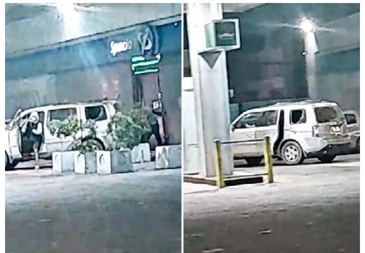
El hecho tuvo lugar en la tienda Spacio 1, dependiente de la bencinera Petrobras, ubicada en la calle Bellavista del plan de la Ciudad Puerto. Antisociales huyeron por Av. Errázuriz.

Como su robo no pudo materializarse, los individuos abordaron la camioneta y escaparon por la avenida Errázuriz en dirección a la Av. Argentina.